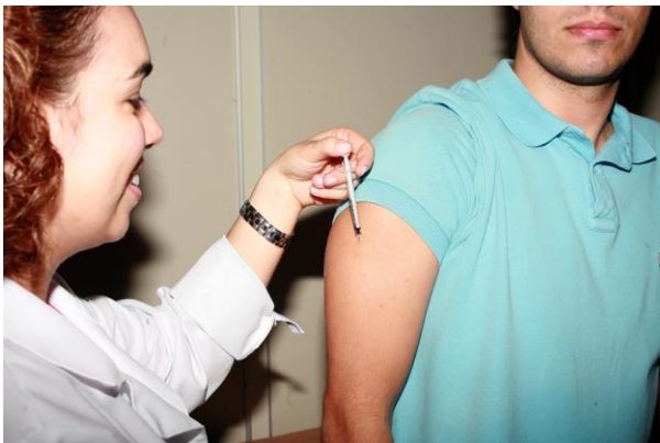
Administração de imunoterapia a paciente com anafilaxia por picada de formiga lava-pé (ALEIT)