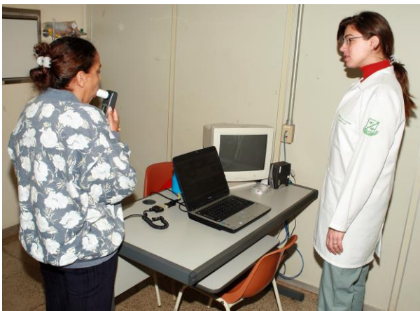
Prova de função pulmonar em realização no Ambulatório de Alergia (ALE)