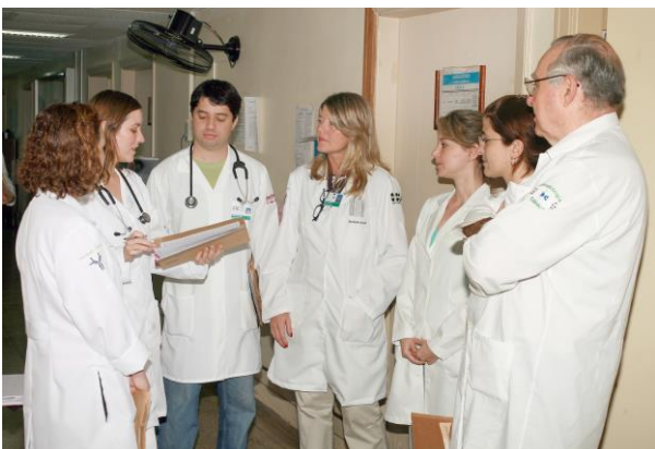
Discussão de caso em andamento no Ambulatório de Alergia (ALE)